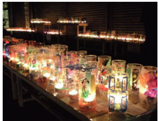
光を入れるとこんな感じになります。